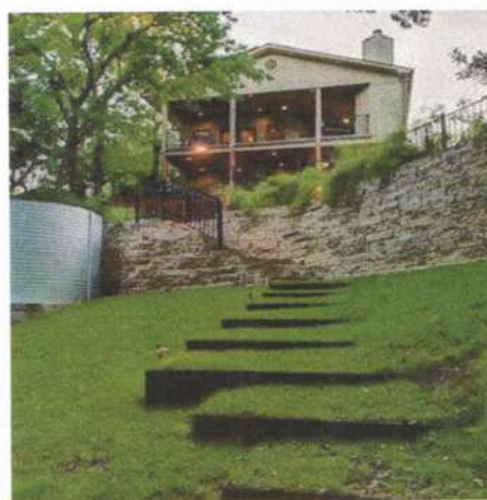
A képek tájékoztató jellegűek, nem a végleges kivitelezést fedik.